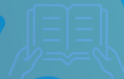
Table nationale en français langue seconde (TNFLS)